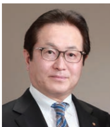
国際ロータリー第2520地区 2023-2024年度 ガバナー