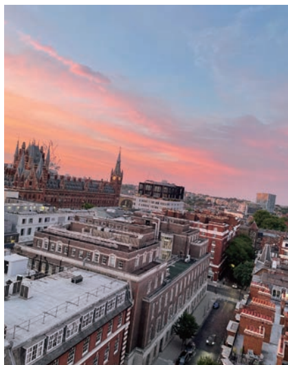
【寮の窓からの風景（ロンドン）】 卒論執筆の合間の気分転換によく眺めていました

ロータリーは母子の健康を重点分野に掲げ質の高い医療へのアクセスの向上など多大な貢献をされてきました。また、教育の支援や地域経済の発展、平和の促進など、他の重点項目の多くが母子の健康を向上させるためにも必要であると考えられているものです。例えばガザ南部のラファで避難生活を送る妊婦は約5万人いると推定されており、医療へのアクセスが阻まれ、極めて高いリスクに晒されています。即時停戦が強く望まれます。