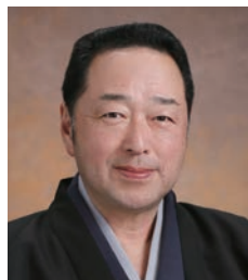
国際ロータリー第2520地区 2025-2026年度 ガバナー