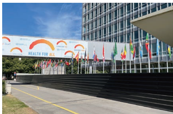
【WHO本部（スイス・ジュネーブ）】 「人類が皆健康でありますように」のメッセージと世界中の国旗が掲げてあります

2023年に報告されたWHOのレポートによりますと、持続可能な開発目標（SDGs）の一つである、「母体死亡率を2030年までに出生10万人あたり70未満まで下げる」という目標の下、2000年から母体死亡率は世界的に減少の一途を辿っていましたが、2016年から2020年までの間にその減少が停滞、あるいは増加に転じる地域が多く見られました。2020年の統計によりますと、毎日約800人の女性が予防可能な妊娠・出産に関連する合併症で命を落としています。それは時間換算すると約2分に1人という概算になります。そして、約95%以上の母体死亡が低中所得国で発生し、その多くがサハラ以南のアフリカと南アジアであったと報告されています。またこういった背景には貧困や紛争などの社会問題や高い出生率、不十分な医療の質やアクセスなどといった様々な要因が考えられています。母体死亡における地域間の格差は未だに顕著でありまして、例えばノルウェーにおいては生涯妊娠・出産に伴い命を落とす女性が約43,000人に1人であるのに対し、アフリカのチャドにおいては約15人に1人と推定されています。特に妊娠・出産に関してはタイムリーで適切なケアが提供できる地域においては、多くの合併症の重症化、そして母体死亡が予防できるのに対して、そういったケアが担保できない地域においては、その多くが悲劇的な結末を辿ってしまうという極端な状況があります。