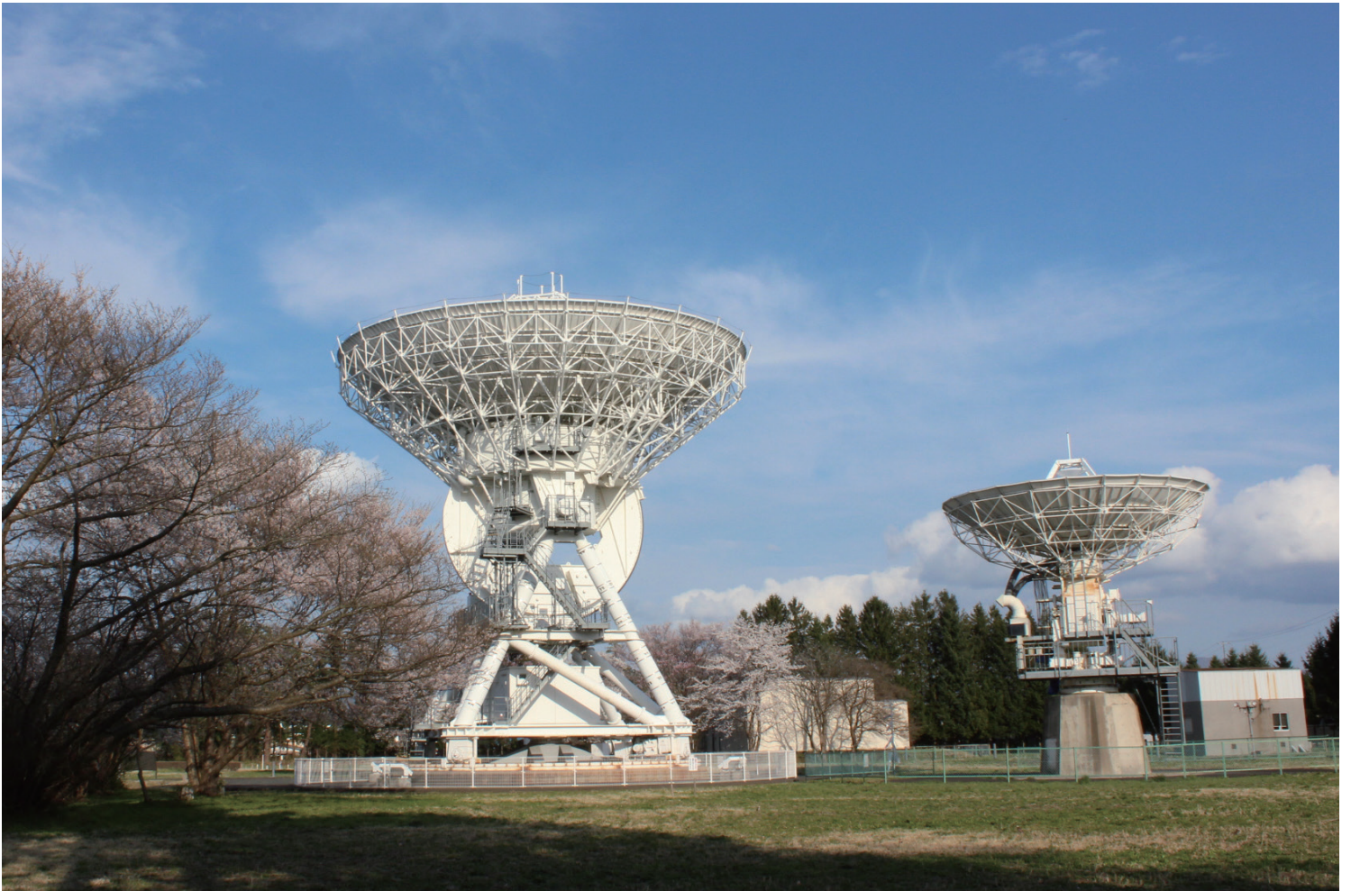
国立天文台水沢 VLBI 観測所

2024-2025 ROTARY INTERNATIONAL DISTRICT 2520