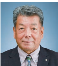
国際ロータリー第2520地区 2026-2027年度 ガバナー