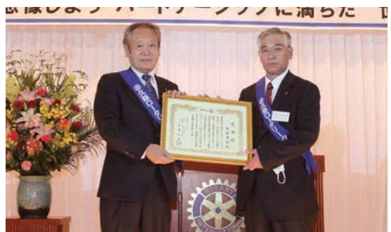
過去10年の歴代会長へ感謝状を贈呈

また記念事業として、岩手県より県史跡指定を受けた「久慈城跡」の歴史案内板をリニューアル致しました。郷土の歴史を学び大事にすることは「街づくりに奉仕する第一歩」と考え選択しました。