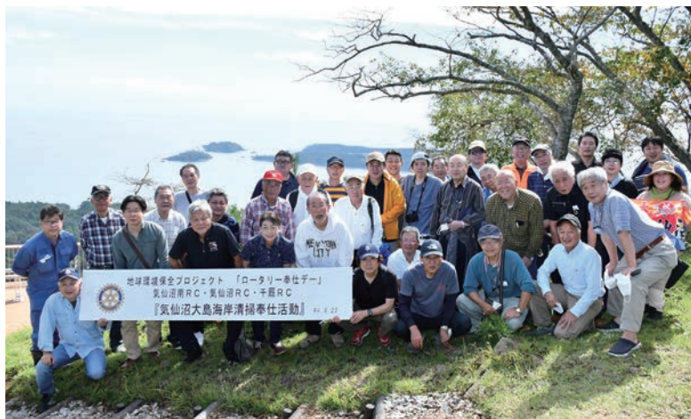
2022年9月25日ロータリーデー

ロータリーデーでは、各クラブの事業を地域の方に発信していただきたい旨、何度もお願いをさせていただきました。私も9月25日当日は、地区スタッフと一緒に気仙沼南ロータリークラブの事業に参加し、千厩ロータリークラブ、気仙沼ロータリークラブの皆さんと一緒に気仙沼大島の海岸清掃をしました。他のクラブの皆さんにも、時期は異なってもロータリーデーという冠をつけて地域の皆さんとともに、清掃活動をしていただきました。地道な活動ですが、地域に向けてみんなで発信することで、私たちロータリークラブというものを認識していただく機会となり、公