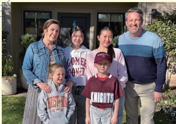
素敵なhost familyとのfamily photo

この研修を通して、オクラホマについてたくさん学び、一緒に行った7人のメンバーとの仲も深まり、自立心も芽生えました。この貴重で素晴らしい経験を、今後に生かしていきたいです。そして今年6月に来るインバウンド生にも同じように感じてもらえるよう、しっかりおもてなしをしたいと思います。