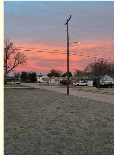
人生で最も美しい夕焼け

最後に、現地の方と会話する際に、自分の伝えたいことを上手く伝えられないことが多かった。そのために、日頃から発音を意識していきたい。