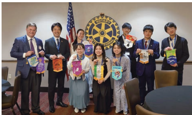
スティルウォーターにて、人生初の海外例会出席。会終了後、各自スポンサークラブのバナーを手に、笑顔でポーズ！

この短期交換プログラムに関わってくださったすべてのロータリアンとそこそご家族、そして派遣生をこころよく送り出してくださいましたご家族に、心より感謝申し上げます。