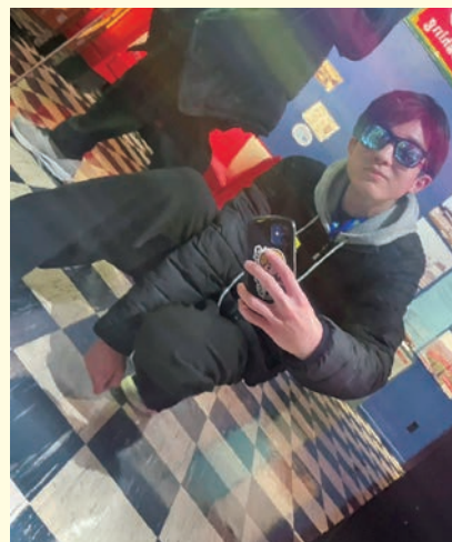
Route 66 Museum（ルート 66 博物館）で不意に撮って上手くいった自撮り。

私は、このような貴重な体験をさせていただいた地区のロータリー、先生方、サポートして下さったすべての方々へ感謝の気持ちを忘れることなく、これからの生活を送ります！