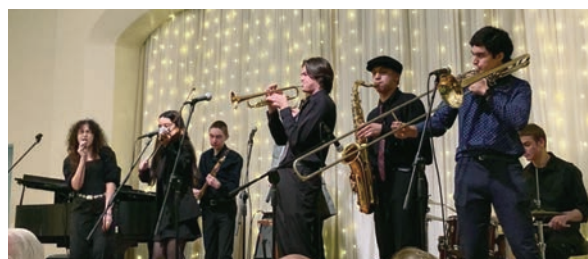
演奏中のMission Bay High School Preservationists

また、2月22日にはMission Bay High School Preservationists Jazz Concertへロータリークラブの方から招いていただいて参加してきました。Mission Bay High School Preservationistsは名前にhigh schoolとあるように高校生のジャズバンドですが、高校生とは思えない迫力のある演奏や歌を披露していました。音楽的にも素晴らしいのですが、一人ひとりが自信を持って楽しそうに音楽を表現している様子に大変感動しました。写真はコンサートの際に撮影したものです。(2023.2.28 報告)