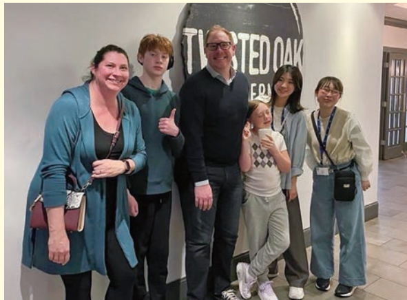
ホストファミリーとの楽しかった思い出

ロータリーの留学だからこそ、初めての海外とは思えないほど安心してプログラムに参加でき、実際に見て、感じて、学べたことはとても貴重な経験になりました。また、日本とアメリカの文化、そして価値観の違いを肌で感じることができました。素晴らしい体験を本当にありがとうございました。