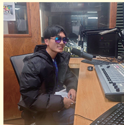
ウェザーフォードの地方ラジオに生出演し自己紹介をしました！一生に何度できるかわからないラジオ出演を、アメリカで経験するとは思いませんでした。

私は、ふたたびロータリーの方々に会ったとき、英会話が上達した自分の姿を見てもらいたい。今回の経験をいかして、勉学に励みます。