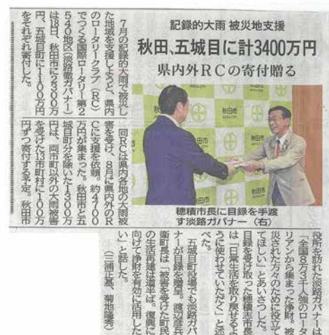
【秋田魁新報：10月19日(木)掲載】