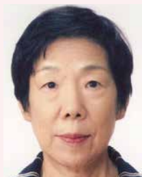
第1分区ガバナー補佐