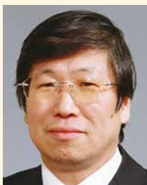
第6分区ガバナー補佐