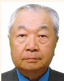
第2分区ガバナー補佐