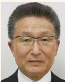
第2分区ガバナー補佐