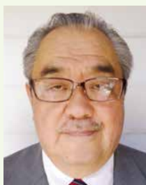
第3分区ガバナー補佐