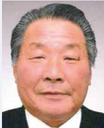
第5分区ガバナー補佐