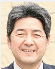
第5分区ガバナー補佐