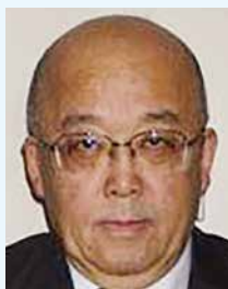
第4分区ガバナー補佐