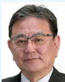
第4分区ガバナー補佐