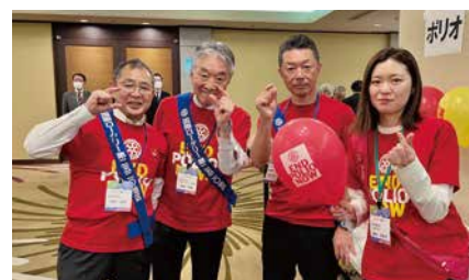
地区ポリオプラス委員会