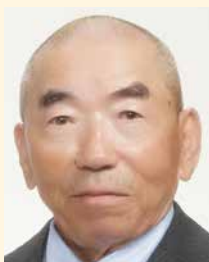
第6分区ガバナー補佐