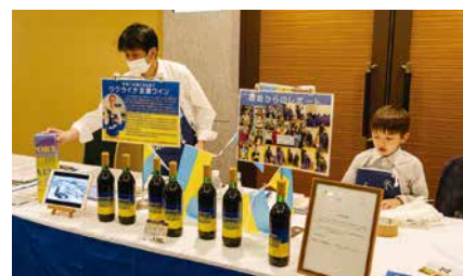
ウクライナ支援ワイン