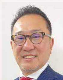
第8分区ガバナー補佐