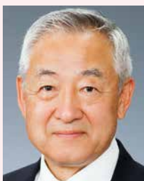
第1分区ガバナー補佐