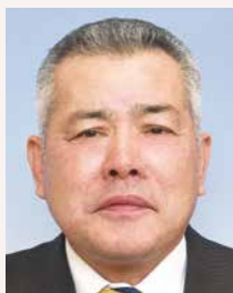
第8分区ガバナー補佐