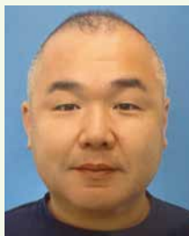
第3分区ガバナー補佐