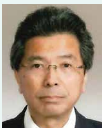
第7分区ガバナー補佐