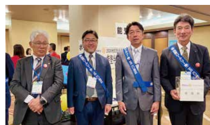
地区社会奉仕委員会 能登半島地震への募金を行いました