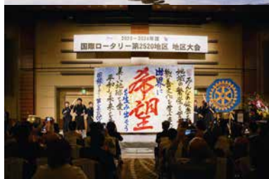
仙台育英学園高等学校書道部による感動的なパフォーマンス