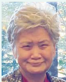
第7分区ガバナー補佐