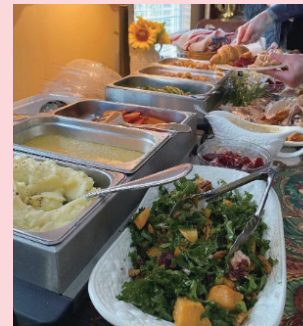
多様な料理が並ぶ様子

現在では、感謝祭は収穫への感謝に加え、家族や友人とのつながりを祝う日として広く親しまれています。当初の宗教的な背景は薄れ、多文化社会のアメリカで多様な形で受け継がれています。この感謝の文化に触れる中で、私自身も日々の生活を振り返り、小さなことから感謝する心が大事であると再認識する機会になりました。日本にもお正月のように家族が一堂に会し、伝統的な料理を楽しむ時間がありますので大事にしていければと思います。このような体験を通して、アメリカ文化の温かさを実感し、私の留学生活はますます充実したものになっています。