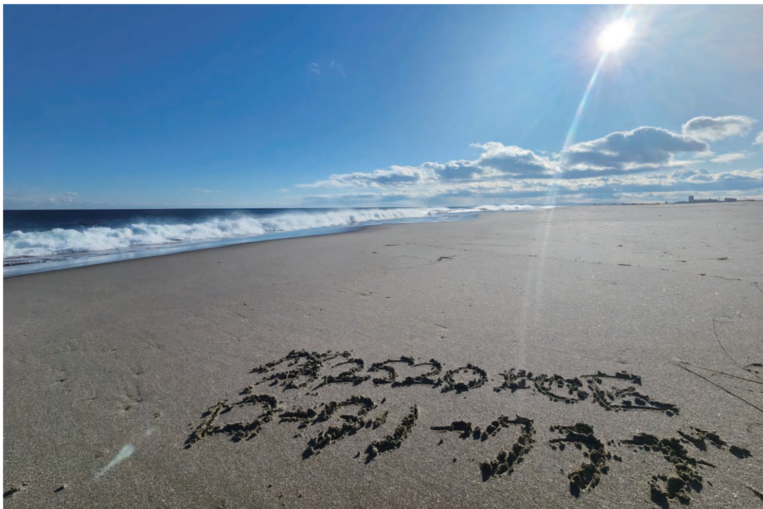
仙台新港

2024-2025 ROTARY INTERNATIONAL DISTRICT 2520