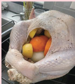
ロースト前のターキー

日本では馴染みはなかったのですが、アメリカの 11 月の風物詩といえば「感謝祭 (Thanksgiving)」です。この日は、家族や友人と集まり、食事を楽しみながら感謝の気持ちを分かち合う伝統的な祝日です。感謝祭は、毎年 11 月の第 4 木曜日に祝われます。その起源は 17 世紀にイギリスからアメリカ大陸に渡航してきたピルグリム (清教徒) たちが、厳しい冬を乗り越えたことにあります。