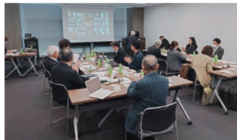
全国 IA 委員長会議

その後、青少年保護、賠償責任保険、短期海外旅行保険等に関するビデオ研修、第 12 回 IA 研究会・長野会議のプレゼンテーション、第 13 回福島会議の案内、D2650 インターアクト委員長からの海外研修実施報告がなされ、青少年育成に対する熱い思いを共有することができました。